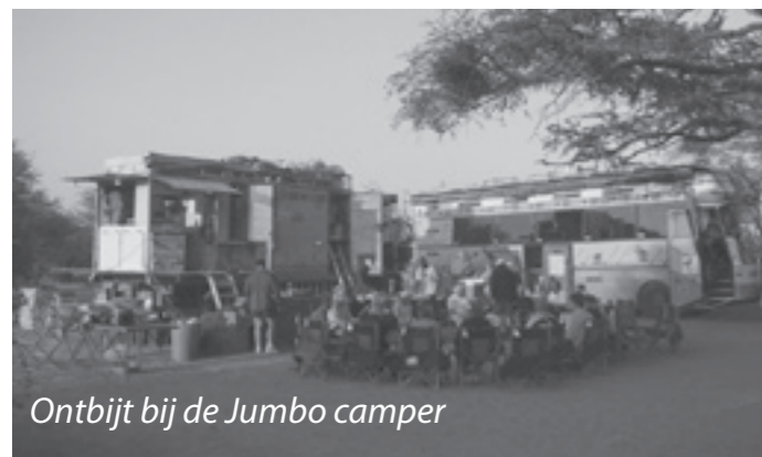
Ontbijt bij de Jumbo camper

Die reis door Rusland natuurlijk, maar heb ook veel door Zwitserland en Oostenrijk gereisd. Treinreizen door de bergen blijft wel het aller mooist vooral met keertunnels in de bergen, je gaat een tunnel in en in de berg maakt de trein een boog van 180 graden om er een tijdje later weer een stuk hoger en er aan de zelfde kant van de helling er weer uit te komen, dit is gemaakt omdat de trein maar een heel beperkte stijging kan maken en zo wordt de afstand langer. In het zuiden van Zwitserland bij Brusio is zo'n 180 graden lus in de openlucht. Dit is ook een Unesco wereld erfgoed.