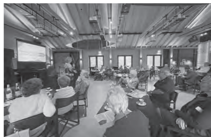
Mw. Heerink in gesprek met de leden van de cliëntenraden