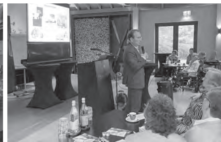
Bestuurders in gesprek met de leden van de cliëntenraden