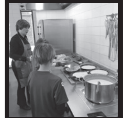
Leerlingen van Basisschool de Groen van Prinsterer kwamen pannenkoeken bakken voor de bewoners van Woonzorg en groepswonen BethSan